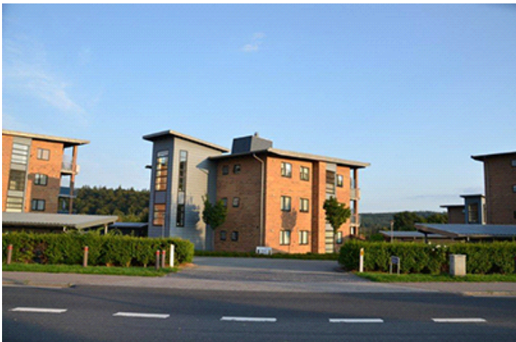
Punkthuse ved Herningvej med mindre kig til skovsskråningerne ved Silkeborg Bad.