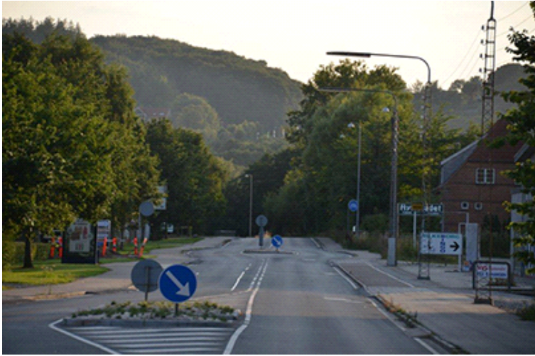
Herningvej med Funder Bakke i baggrunden.