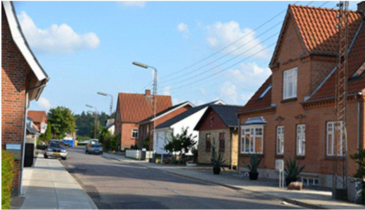
Området ved Lysbrogade nærmest den tidligere Lysbro Station har stadigvæk karakter af "stationsbebyggelse".