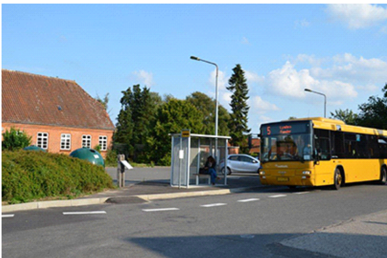
Busvendepladsen ved købmanden.