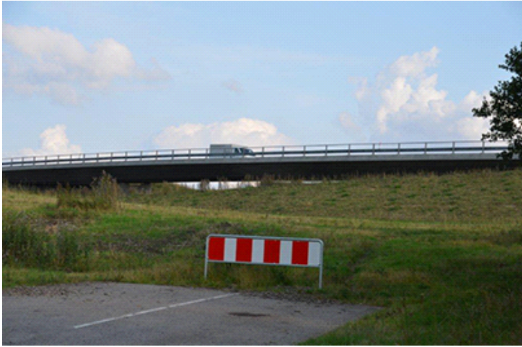
Nye motorvejsanlæg set syd for Funder Kirkeby ved Skærskovvej.