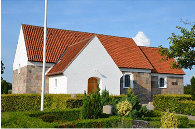
Funder Kirke - en middelalderkirke som også er Hærvejskirke.